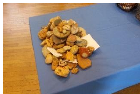
Cairn construit au cours de la célébration

La date du prochain week-end de rentrée est fixée du vendredi 3 au 5 octobre 2014. Et l'assemblée Générale aura lieu dans la foulée le dimanche 5 octobre.