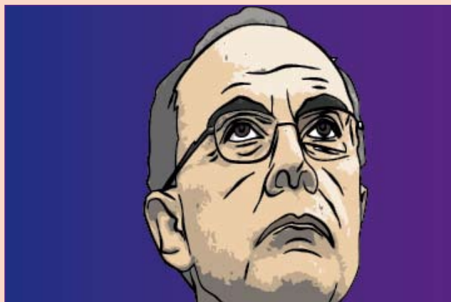
Le cardinal Barbarin

L'éditeur de Romain Guérin n'est autre qu'Adrien Abauzit qui préside la maison d'édition Altitude présentée comme suit : « Née de l'amour que ses fondateurs portent à la France, animés